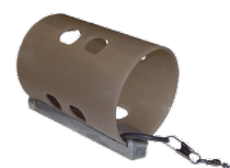
Open End Feeder