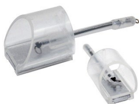
Pellet Feeder Elasticated