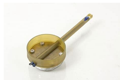
Banjo Feeder Elasticated