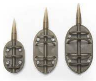
Flat Method Feeder